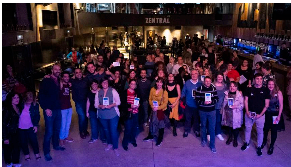
Acto del 25 aniversario de la Red Navarra.