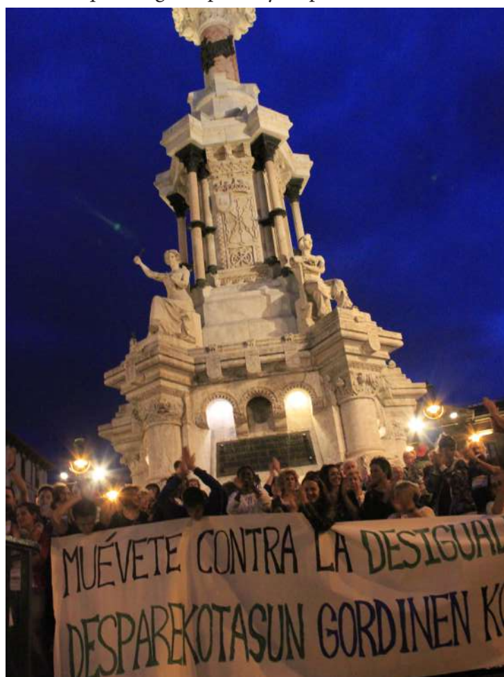
Día Internacional de Lucha contra la Pobreza.