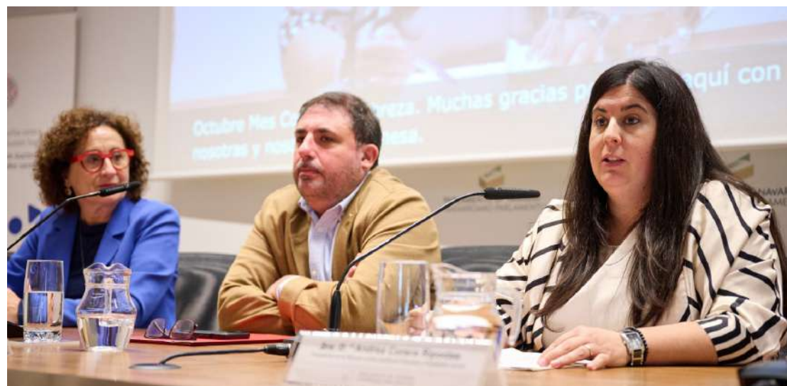
Acto en el Parlamento de Navarra.

Una sociedad comprometida con los DDHH es una sociedad que convive en paz y que integra a todas las personas. Y ese es el objetivo que nos lleva a seguir trabajando.