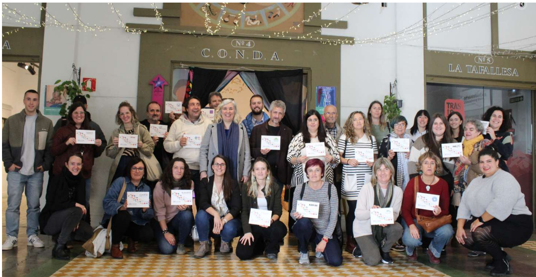
Acto conmemorativo del 30 aniversario de la Red Navarra.